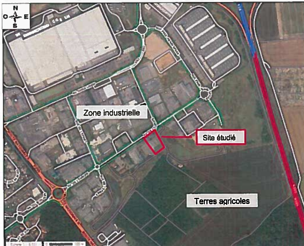
Figure 2 : Présentation du site et de son environnement immédiat